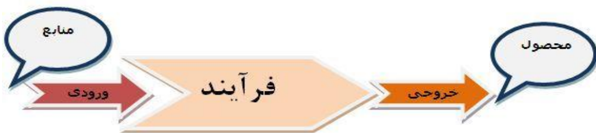
شکل ۱- نقشه فرایند

فرایندهای مدیریتی: این فرایندها با هدف بالا بردن سطح کارایی زنجیره ارزش با فرایندهای اصلی و پشتیبانی آن انجام