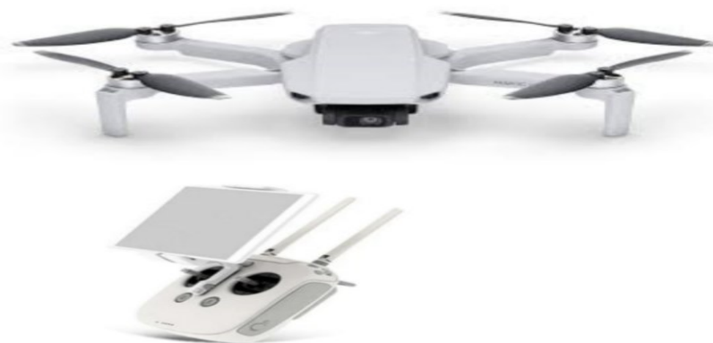
شکل ۱- پهباد ADS-B منطقه تحت مطالعه، پارسل ۳۰۷

در این پژوهش ۳۰ قطعه نمونه (sample area) با استفاده از روش منظم تصادفی (سیستماتیک- تصادفی) در سیستم مختصات (UTM) پیاده شد. در این تحقیق از پهبادی ADS-B استفاده شد. سپس با استفاده از پهباد مشخصه دمای مراکز قطعه نمونه در ارتفاعی مشخص در تیرماه سال جاری ۱۴۰۱ به دست آورده شد با استفاده از روابط رگرسیونی به تعیین زی توده رویه سطحی درختان با استفاده از روابط آلومتریکی پرداخته شد. در مدل آلومتریکی مشخصه دمای درختان به عنوان متغیر اصلی و مشخصه زی توده به عنوان مشخصه فرعی یا وابسته در نظر گرفته شده است. در این تحقیق با استفاده مدل های تهیه شده اندوخته کربن درختان در مراحل رویشی تیرک، تیر، تنومند، پیردار محاسبه شد. سیستم مختصات